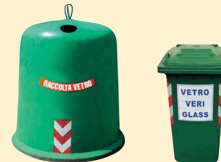
CASSONETTI CONTRASSEGNA TI VETRO, VERI, GLASS, LATTINE