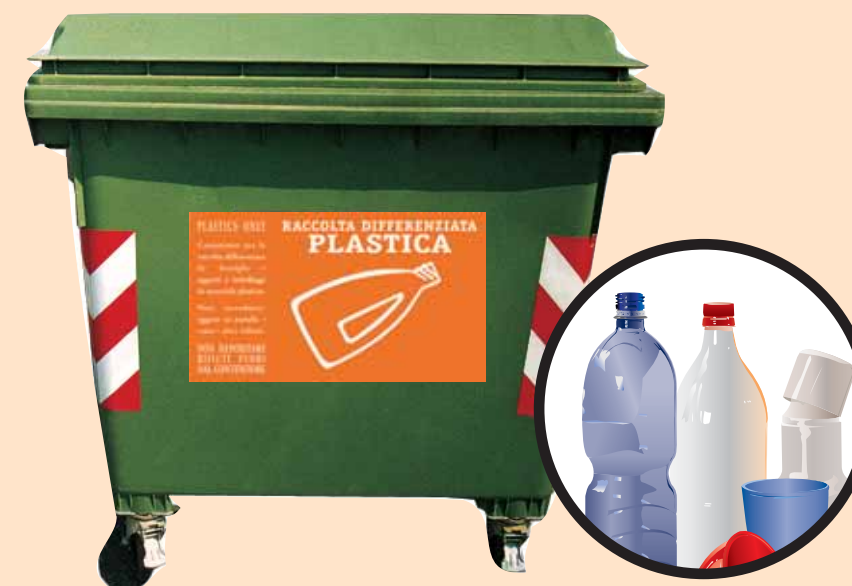
CASSONETTI CON ADESIVO ARANCIO